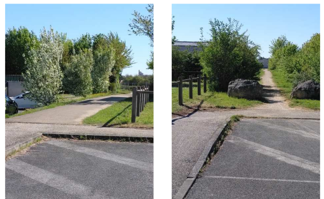
entre les rues L.-Blériot et L.-Sedar-Senghor

Le cheminement cyclable n'est pas suffisamment repéré. Le fléchage indicatif n'existe qu'à l'entrée de la rue Blériot, il est inexistant ensuite, ainsi que dans le sens inverse.