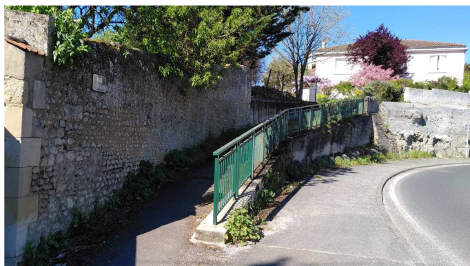
rue de la Basse roche – avenue de Nantes