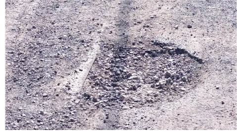
chemin de Roule-Cul

D'importants nids de poule ( par exemple sur le chemin de Roule-Cul ), apparaissent sur les différents « chemins blancs » de Grand-Poitiers, et sont dangereux pour les cyclistes. L'entretien régulier de ces chemins est indispensable.