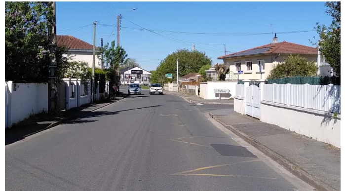
rue Georges-Guynemer vers la rocade

Des figurines plus grandes et placées au tiers de la chaussée sont préférables ( comme dans le bas de la même rue ) ; une séparation peinte serait également bienvenue.