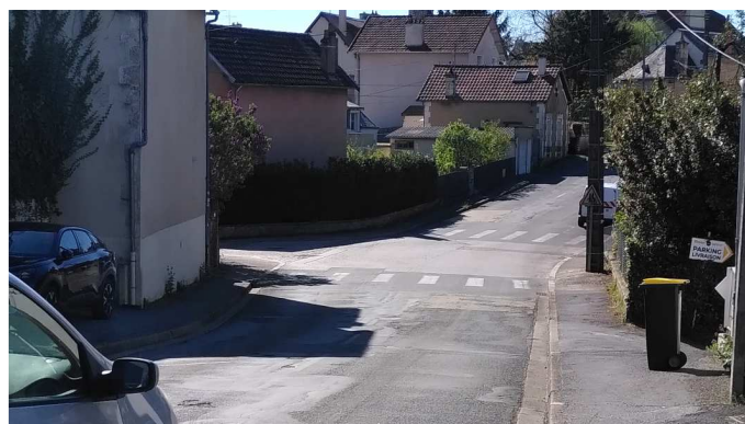
carrefour du haut des Montgorges

Des ralentisseurs supplémentaires et/ou des chicanes « en dur » sont nécessaires pour sécuriser ce carrefour.