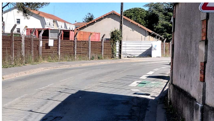
virage à hauteur du R.I.C.M.