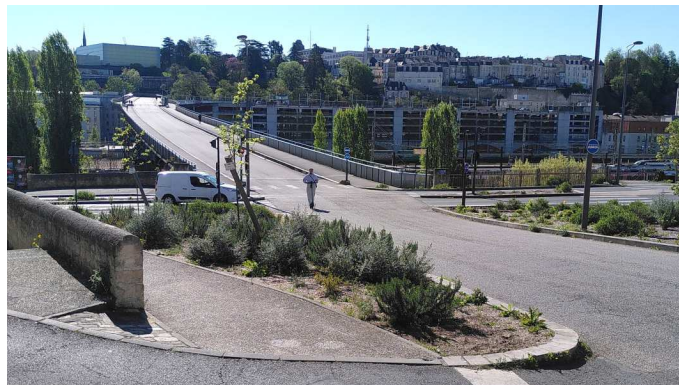
Léon-Blum – av. de Nantes

La configuration de ce « passage à niveau » doit être modifiée : la visibilité n'y est pas bonne, le déclenchement automatique des feux par les cycles n'est pas efficiente ( trop tard, ou pas du tout ), les voitures ne sont pas ralenties efficacement, le feu orange clignotant n'est pas assez impératif. Un carrefour à feux classique, avec détection spécifique des bus suffisamment en amont pour ne pas les ralentir, serait préférable.