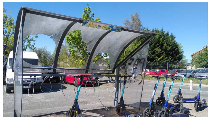
parcibus de la Demi-Lune

Ces deux derniers points montrent qu'un entretien régulier des équipements existants doit être programmé.