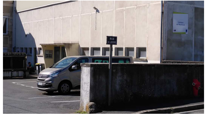
gymnase de Montmidi