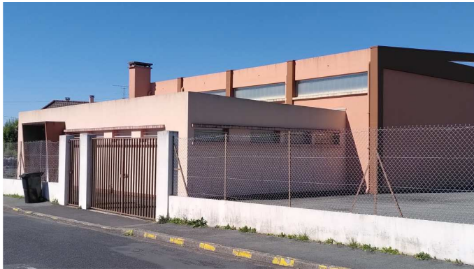
gymnase de Bel-Air